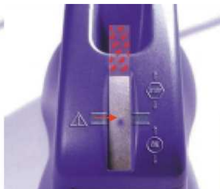
Se recomienda cambiar el aceite