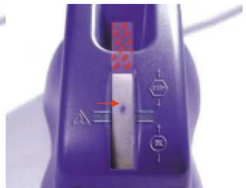
Desechar el aceite